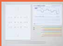
クランク芯材セット