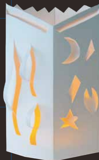
ホワイトペーパーランプ (画用紙作品)