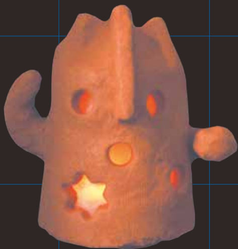
はにわランプ (クレイド作品／半紙使用)