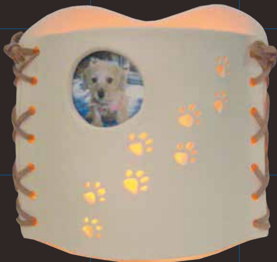
ワンちゃんの足型ランプ (フォルモ作品／革ひも使用)