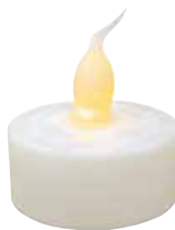
LEDキャンドル テスト用ボタン電池付き