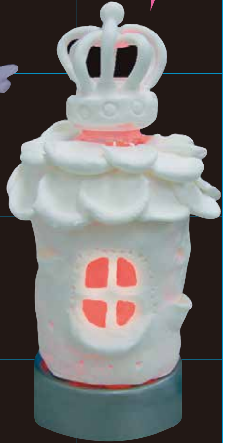
ペットボトルとスーパーカルモ作品