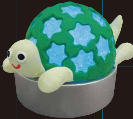
カプセルとスーパーカルモ作品