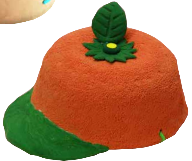
オレンジキャップ(スーパーカルモミニ3色セット・スーパーカルモ50g 各1個)