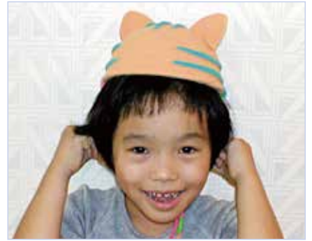
ネコのぼうし (スーパーカルモ-S・ミニ3色セット 各1個)