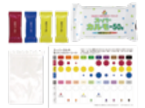
スーパーカルモ4色セット