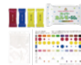
スーパーカルモ4色セット