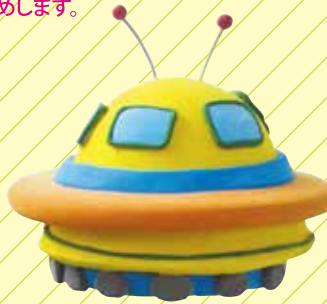
謎の円盤 スーパーカルモ-S