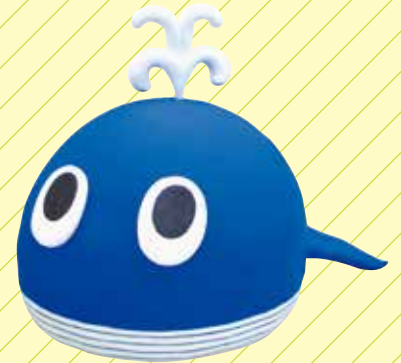
くじらくん スーパーカルモ 50g