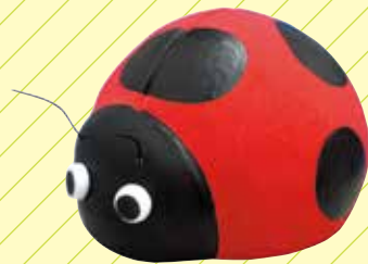
てんとう虫 スーパーカルモ 50g