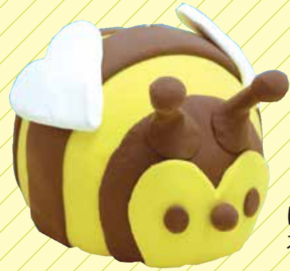
はち スーパーカルモ-S