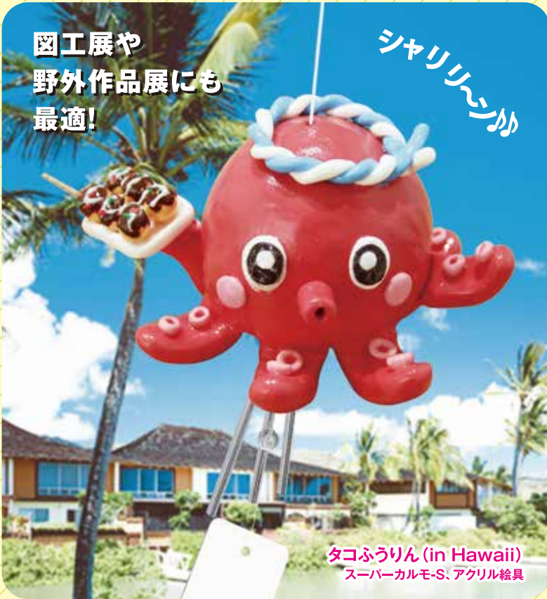
タコふうりん (in Hawaii) スーパーカルモ-S、アグリル絵具